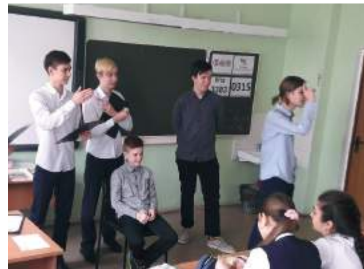
Проект «Командообразование», волонтеры 9-го класса работают с 5-м классом.

Потенциальные волонтеры готовят свое краткое резюме (заполняют готовую анкету), ищут волонтерские вакансии, предлагают свои услуги.